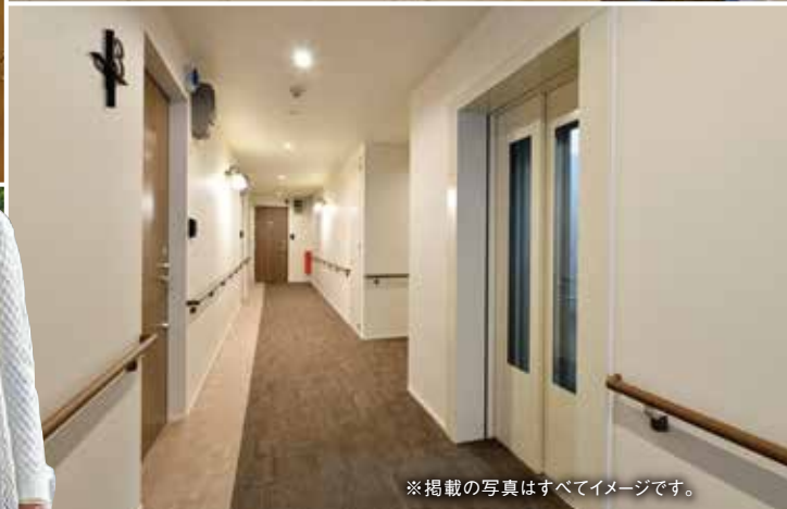
※掲載の写真はすべてイメージです。